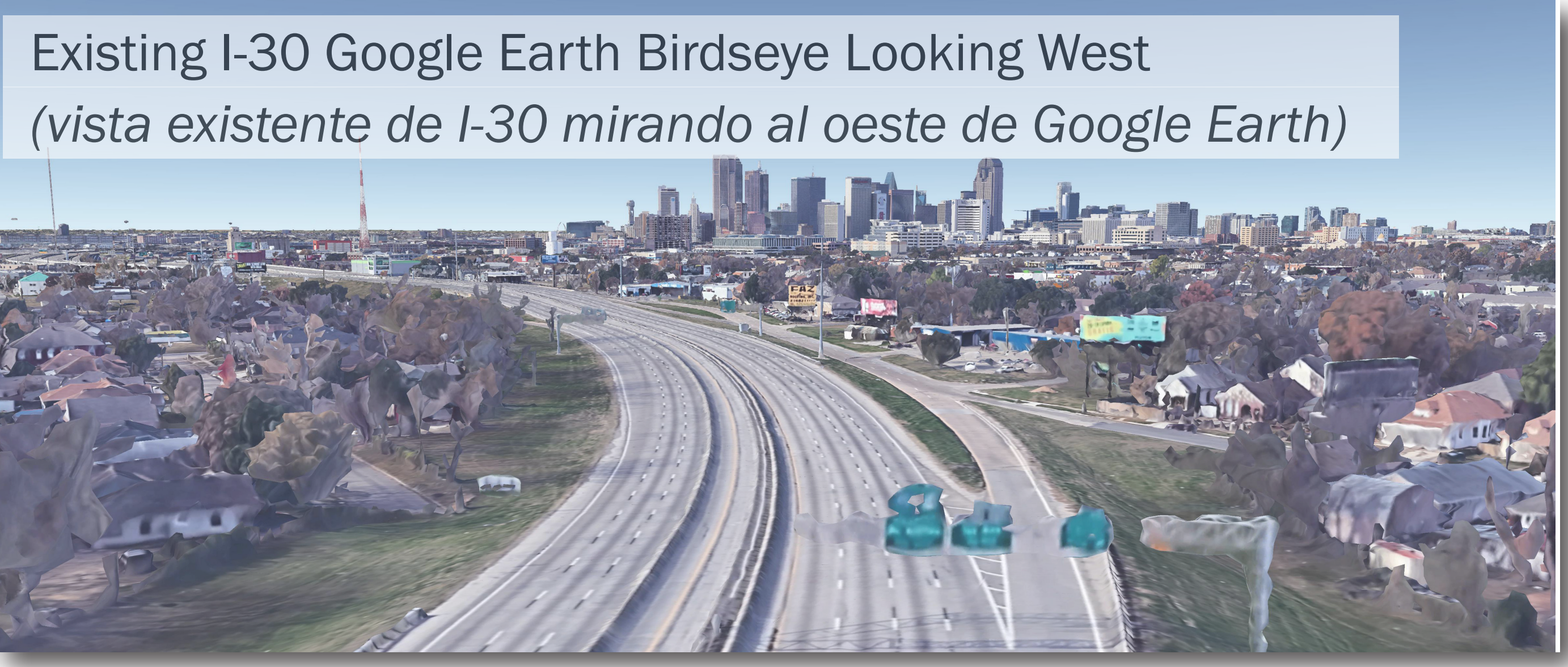
Existing I-30 Google Earth Birdseye Looking West (vista existente de I-30 mirando al oeste de Google Earth)